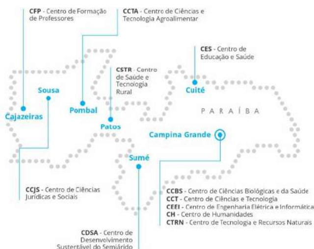
Mapa de atuação da UFCG